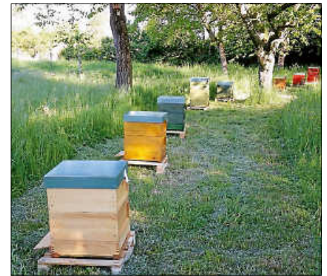
Beuten im Horbachpark